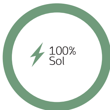
Din individuelle eldeklaration Udledning af CO 2 : 0 g/kWh

Din virksomhed har købt strøm fra nordiske solceller. Herunder finder du eldeklarationen for henholdsvis solenergi og den generelle eldeklaration. Beregningen er baseret på retningslinjer fra Energinet.dk.